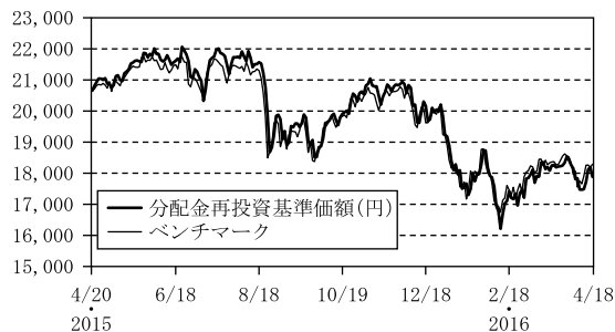
基準価額とベンチマークの推移

(注1) ベンチマークは期首の値を当ファンドの基準価額と同一になるように指数化しています。