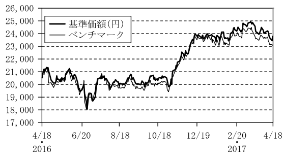
基準価額とベンチマークの推移

(注) ベンチマークは期首の値を当マザーファンドの基準価額と同一になるように指数化しています。